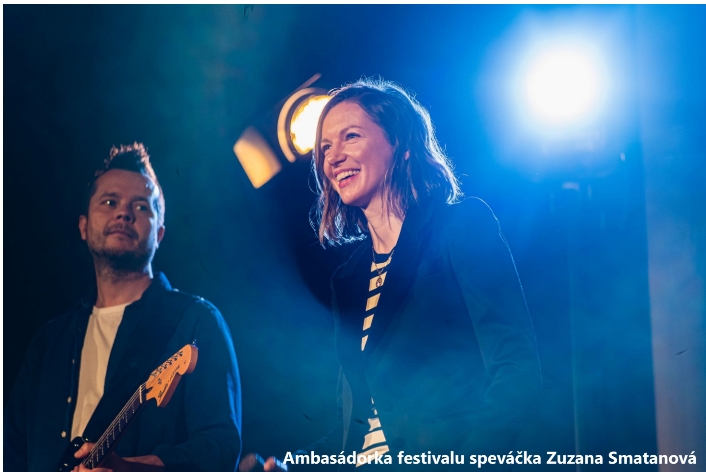
Ambasádorka festivalu speváčka Zuzana Smatanová

AGROFILM JE JEDINEČNÝ FILMOVÝ FESTIVAL O POĽNOHOSPODÁRSTVE, POTRAVINÁRSTVE, TRVALO UDRŽATEĽNOM VYUŽÍVANÍ PRÍRODNÝCH ZDROJOV, O VEDE, VÝSKUME A ŽIVOTE NA VIDIEKU